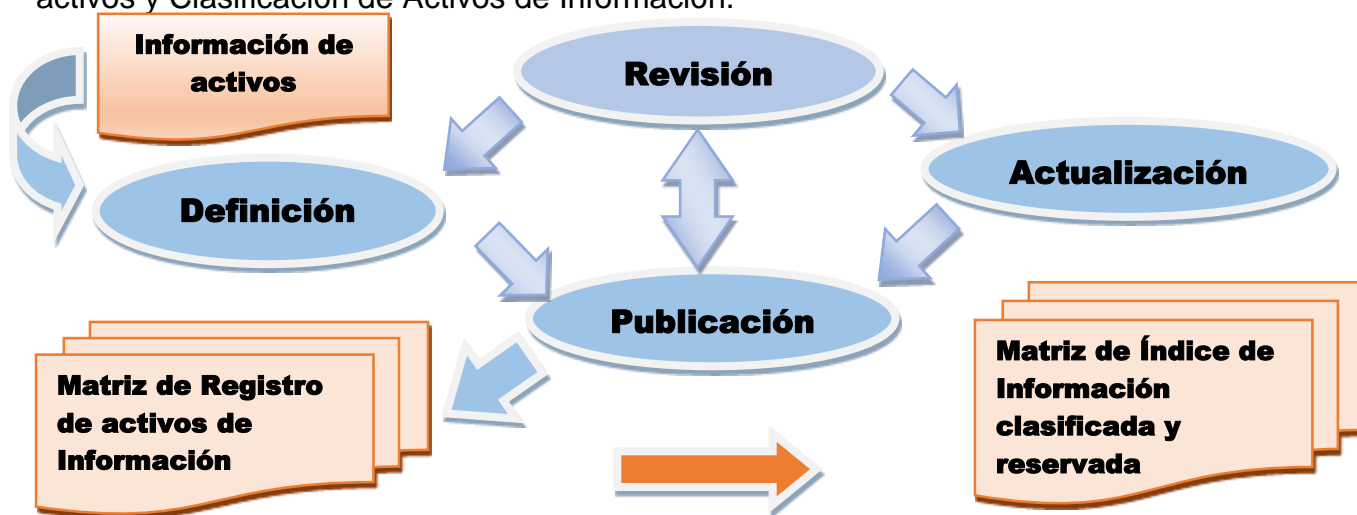
Imagen 1. Procedimiento para registro de activos de activos.

Las actividades a realizar para obtener un registro de activos inician con la Definición, Revisión, Actualización y Publicación, las cuales se reflejan documentalmente en la Matriz de Registro de activos y Clasificación de Activos de Información.